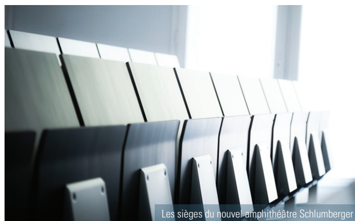
Les sièges du nouvel amphithéâtre Schlumberger

Merci à l'ensemble des générations de mineurs et à tous les donateurs pour leur confiance !