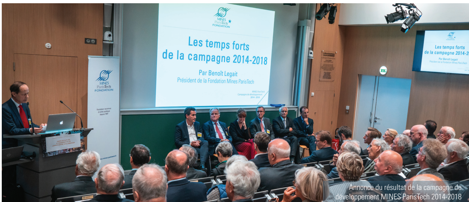
Annnonce du résultat de la campagne de développement MINES ParisTech 2014-2018