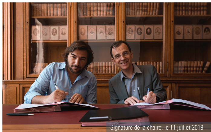
Signature de la chaire, le 11 juillet 2019

Dédiée à l' open innovation et la haute technologie , répondant ainsi aux grands défis sociétaux , tels que le changement climatique, le transport durable et les sources d'énergies renouvelables, cette chaire ouvre un chemin créatif pédagogique complémentaire pour l'École.